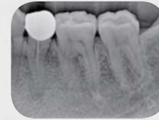
HR / High Resolution