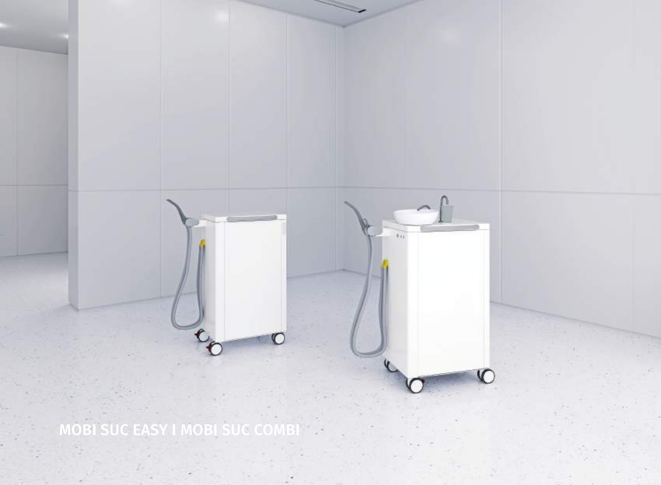
MOBI SUC EASY | MOBI SUC COMBI