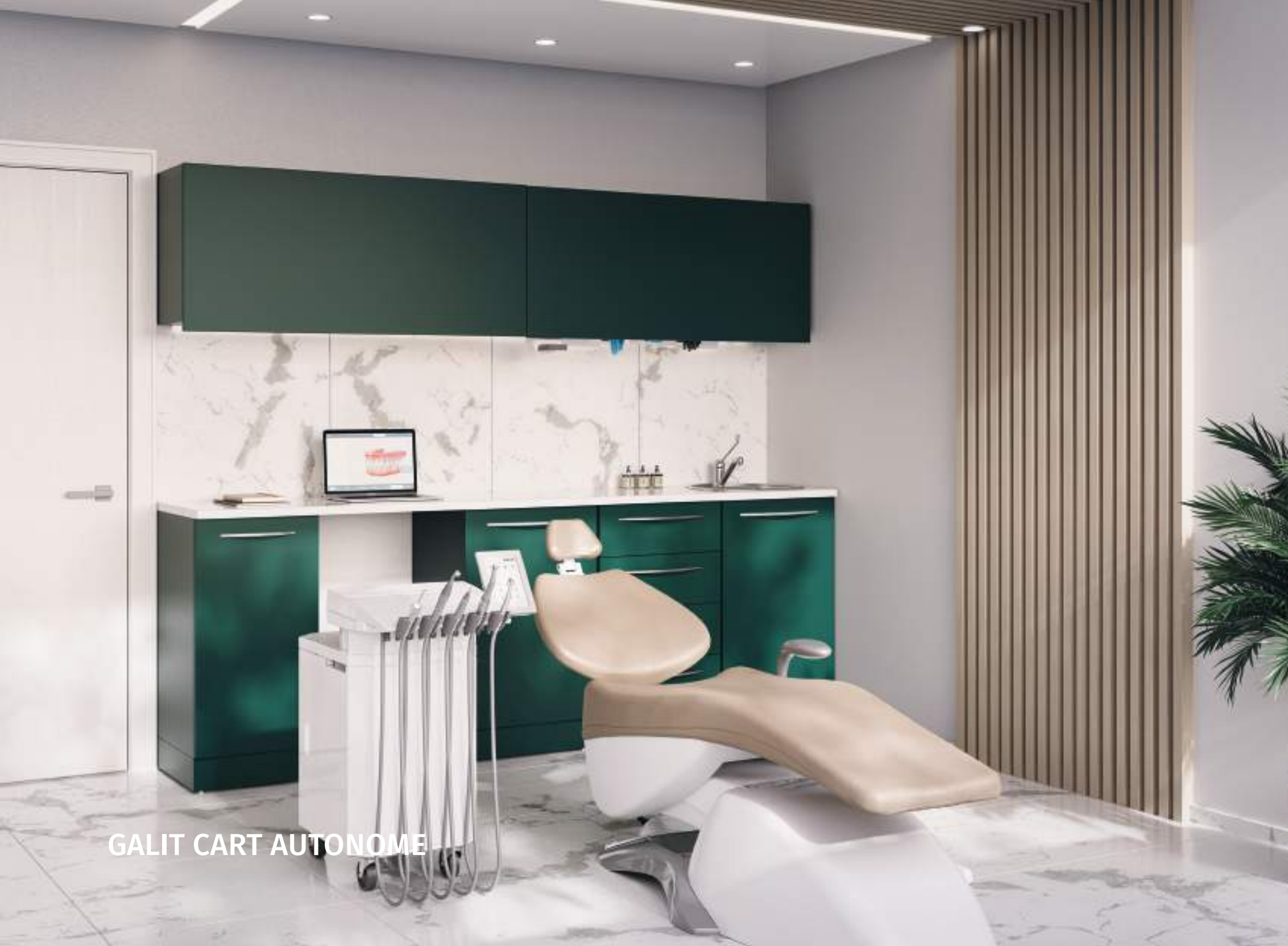
GALIT CART AUTONOME