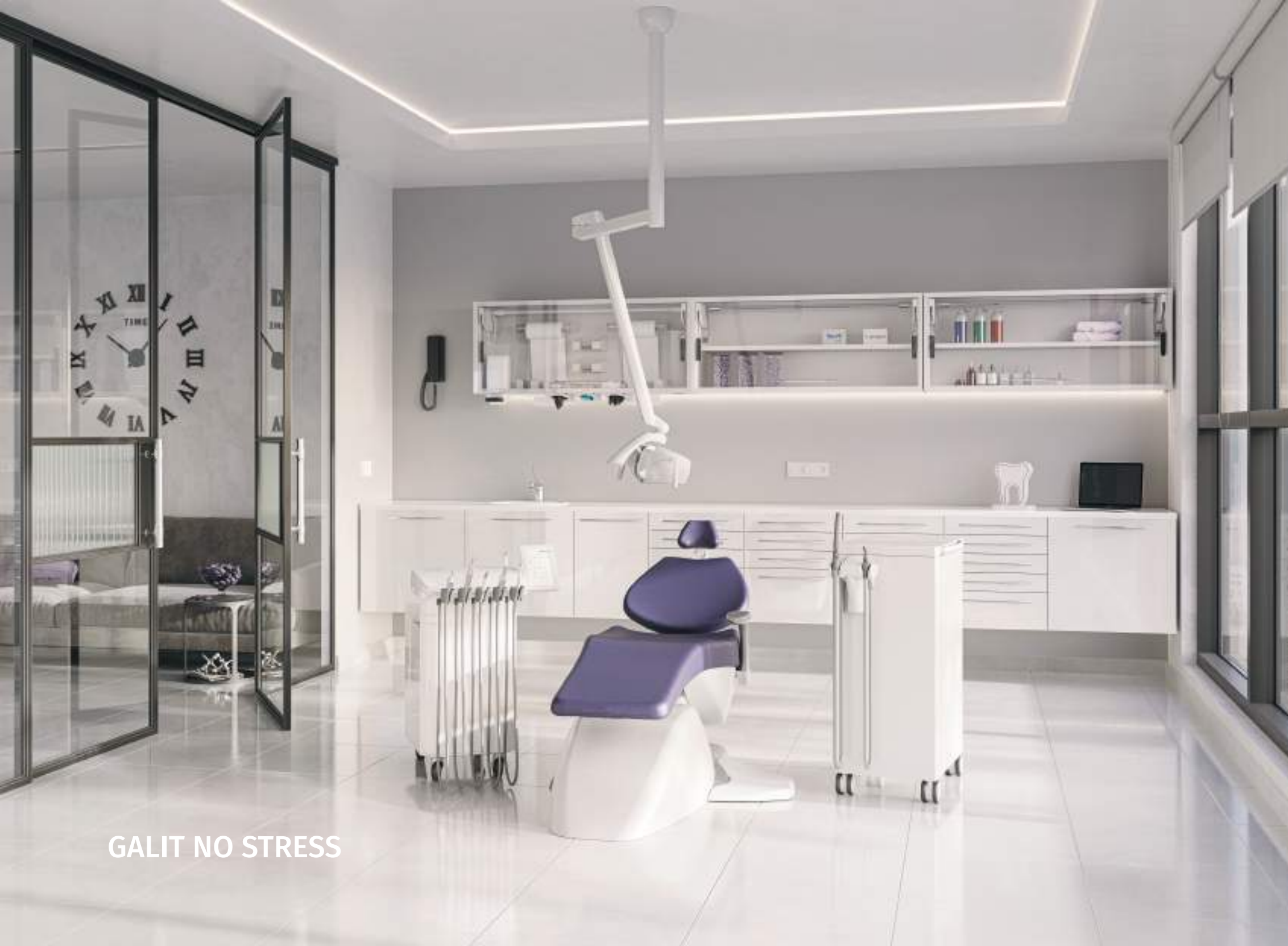
GALIT NO STRESS