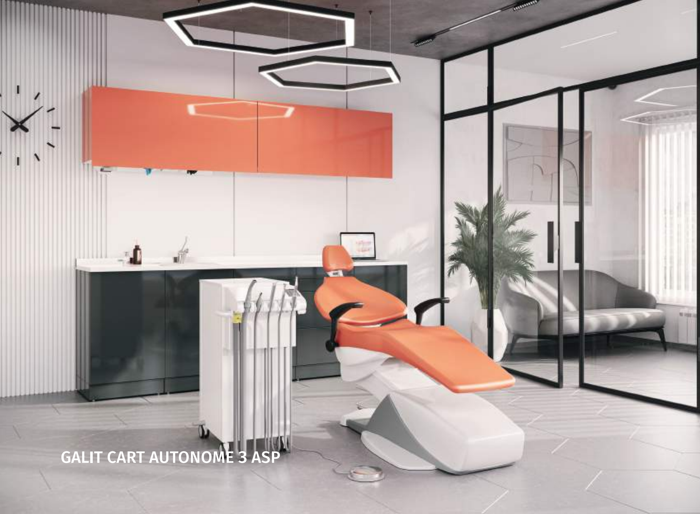
GALIT CART AUTONOME 3 ASP