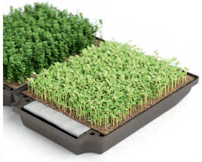
Vier herausnehmbare Schälchen für die Anzucht unterschiedlicher Sprossen Four removable trays for growing different sprouts