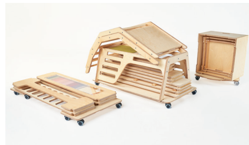
KRIPPE/U3 BENGT, ELSA, TILDA UND CO.